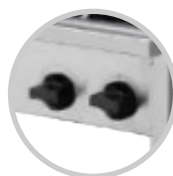
perillas de consumo de gas