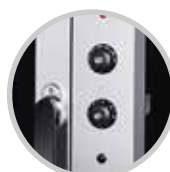
control de temperatura y tiempo

Los hornos convectoros eléctricos con humificador de Cousiño Ltda. son la solución ideal para cocinas profesionales que requieren versatilidad y eficiencia. Fabricados en acero inoxidable de alta calidad, estos hornos permiten hornear, cocinar, descongelar y recalentar alimentos con precisión. Su sistema de humificación garantiza una cocción uniforme y jugosa, mientras que la puerta de doble cristal templado asegura seguridad y aislamiento térmico. Con modelos de 4 bandejas son perfectos para negocios que buscan optimizar su producción y mejorar la calidad de sus platos.