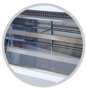
acero de alta durabilidad